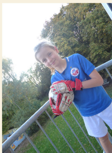
Reporter Willi als Torwart